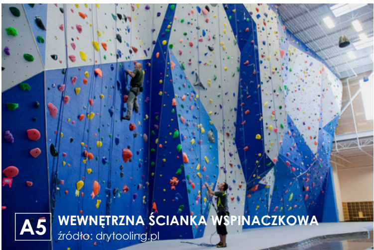
A5 WEWNĘTRZNA ŚCIANKA WSPINACZKOWA