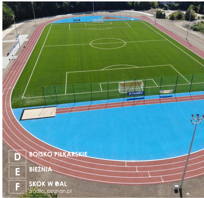
D BOISKO PIŁKARSKIE E BIEŻNIA F SKOK W DŁAŁ