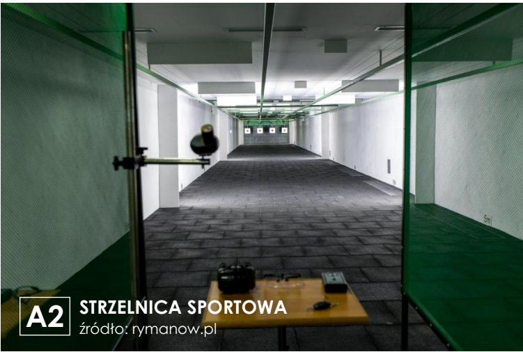
A2 STRZELNICA SPORTOWA