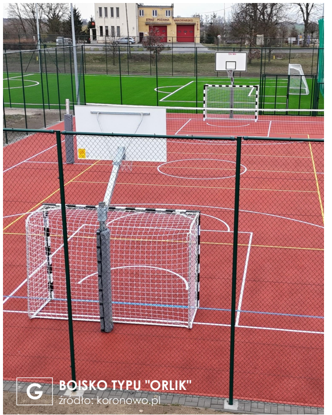
G BOISKO TYPU "ORLIK"