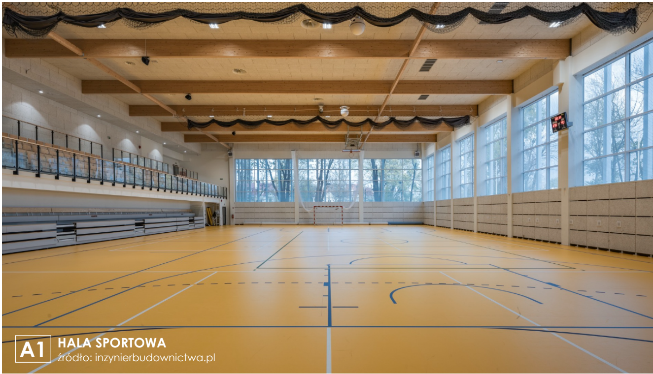
A1 HALA SPORTOWA