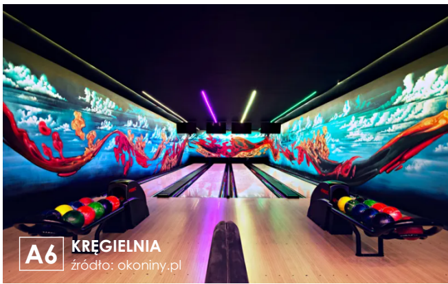
A6 KRĘGIELNIA