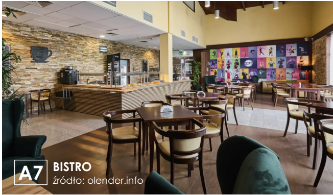
A7 BISTRO