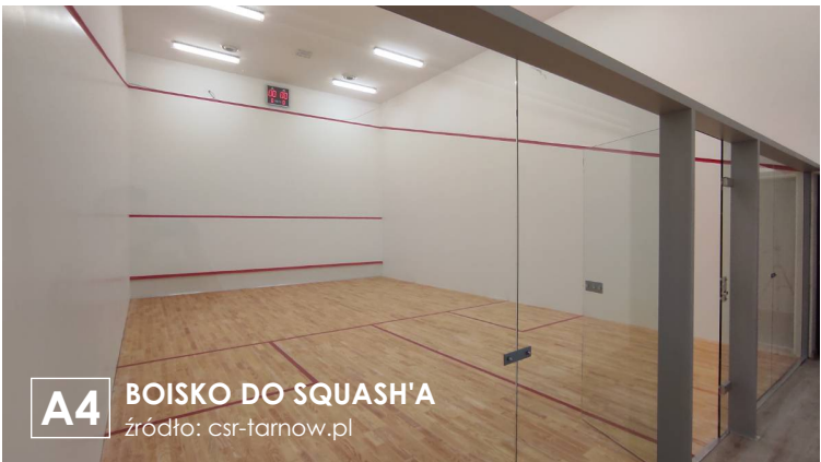
A4 BOISKO DO SQUASH'A