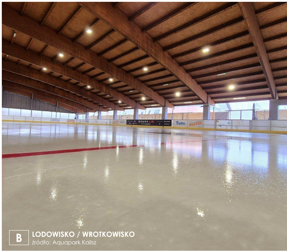
B ŁODOWISKO / WROTKOWISKO