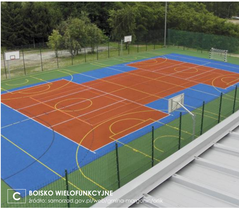
C BOISKO WIELOFUNKCYJNE