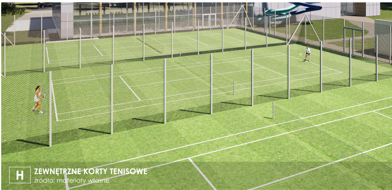
H ZEWNĘTRZNE KORTY TENISOWE