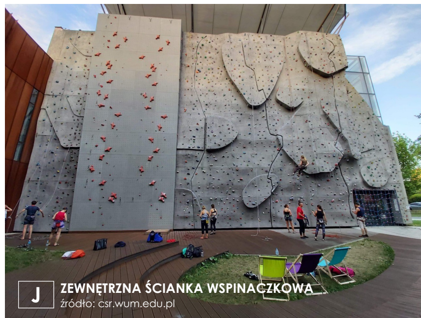
J ZEWNĘTRZNA ŚCIANKA WSPINACZKOWA