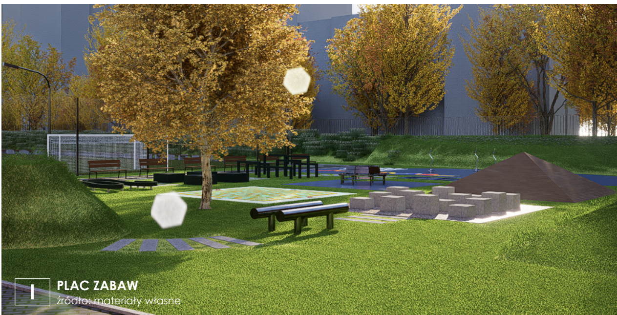
I PLAC ZABAW