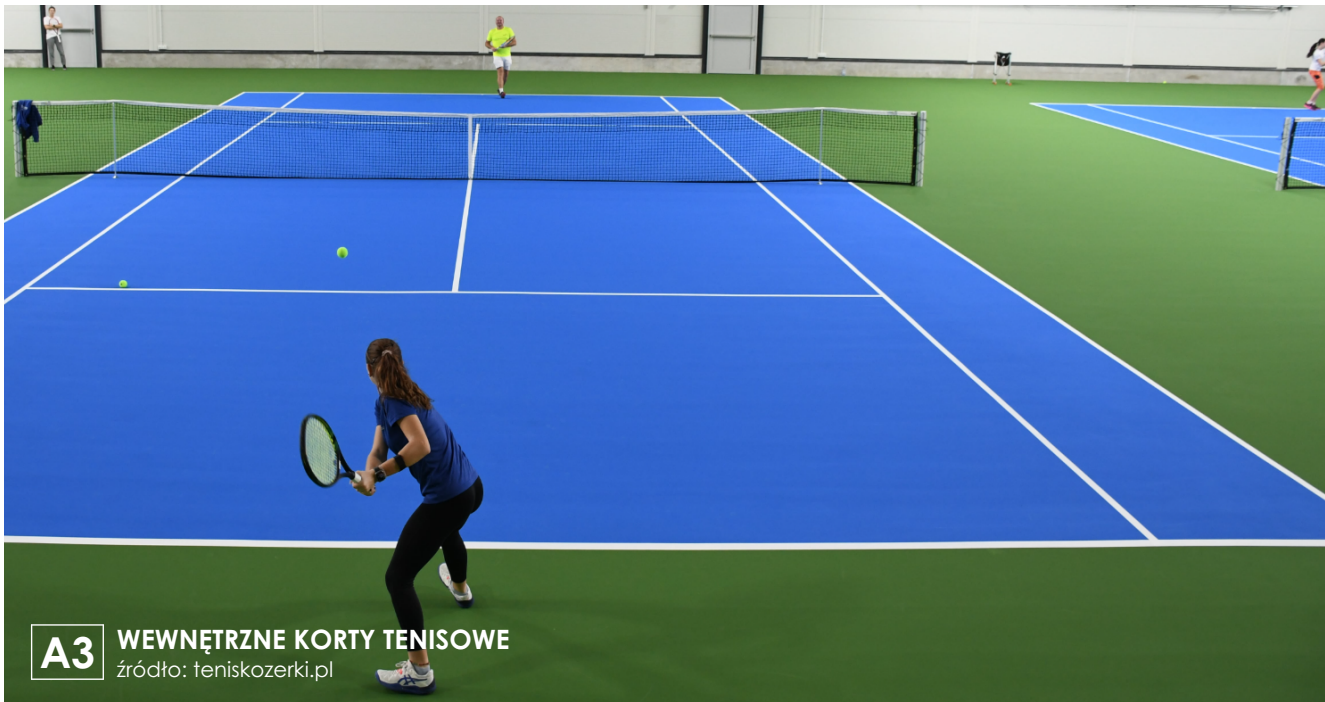
A3 WEWNĘTRZNE KORTY TENISOWE